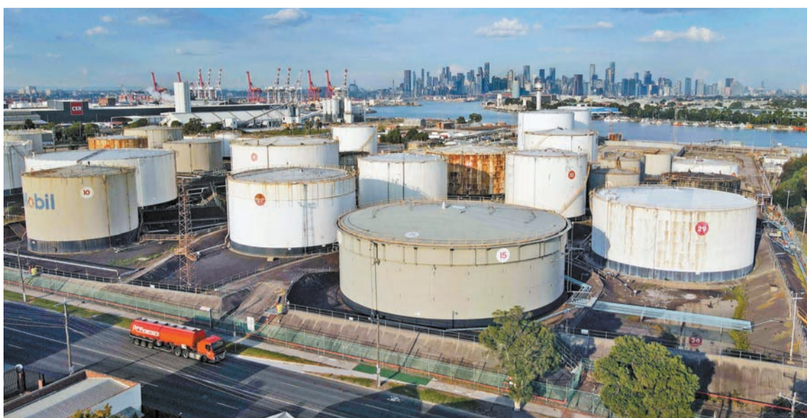
為應對油價不斷飆升，多國已釋出石油儲備。

除能源外，糧食與肥料市場同樣受到衝擊。IMF警告，從中東到拉丁美洲，多國正面臨食品價格上升壓力，特別是在北半球進入播種季之際，來自波