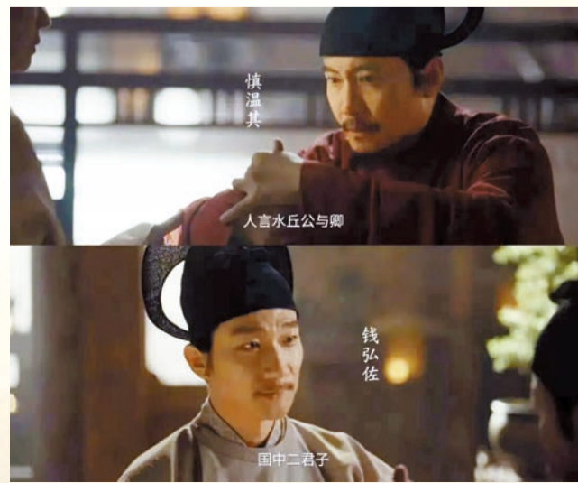
短短幾句對白，盡顯慎溫其的文臣風骨與坦蕩磊落。