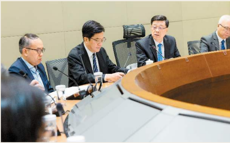
李家超（右二）昨日主持特別會議，聽取跨部門監察燃油供應專責組匯報國際油價波動情況。

【香港商報訊】記者馮仁樂報導：昨日，行政長官李家超主持特別會議，聽取特区政府早前因應中東戰事而成立的「跨部門監察燃油供應專責組」（專責組）匯報國際油價波動情況，對香港整體經濟、貿易和不同行業的影響，並最終接納專責組提出的4項針對性建議。因應相關補貼措施涉及近20億元，須經立法會財務委員會批准撥款，政府會聯絡立法會盡早安排會議並落實措施，以紓解民困。