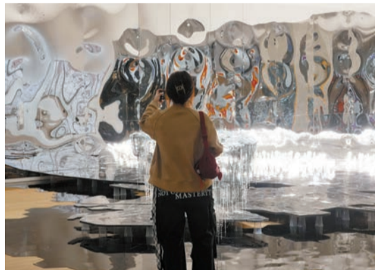
《太陽城II》把部分展廳空間捲入反射之中。