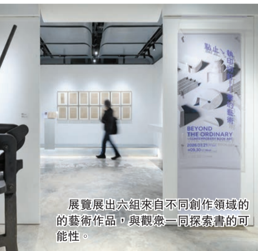
展覽展出六組來自不同創作領域的藝術作品，與觀眾一同探索書的可能性。

版印藝為藝文創作所帶來的可能。展覽並設有多個講座、工作坊、參展藝術家系列活動，讓大眾從不同角度接觸及了解傳統印刷工藝。