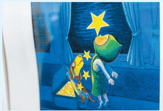
展覽劃分三個區域，透過平面、光影與立體，邀請觀眾走進幾米的世界。