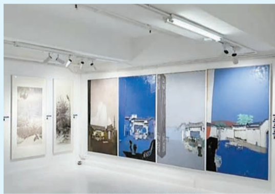
展覽展現青年藝術家多元鮮活的創作面貌。

此次國家藝術基金項目「以藝術之名，講述青春故事——海峽兩岸暨香港、澳門青年藝術家作品交流展」（香港站）在境·美術館舉辦，與境·美術館聯合中國國際水墨學會共同主辦的「香江藝術之春：青年藝術家提名展」一脈相承、同以青年為題，其中，不少參展的香港青年藝術家，也剛剛加入中國國際水墨學會香港青年視藝藝術分會，這正是青年藝術力量凝聚、攜手共進的生動體現。展覽向社會傳達新時代青年藝術家扎根中華文化沃土、勇於探索創新的蓬勃朝氣與時代力量。