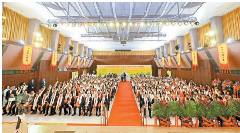
▲大典現場。