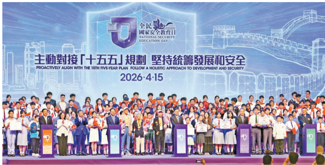
昨日，「全民國家安全教育日」開幕典禮暨主題講座在香港會議展覽中心大會堂舉行。