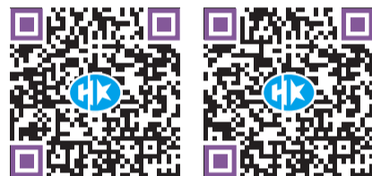
掃碼睇相關致辭全文及回應