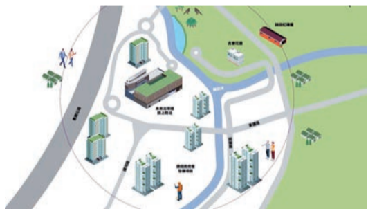
錦上路站第二期物業發展項目示意圖。

港鐵表示，中標財團具規模及信譽優良，過去曾參與港鐵的物業發展項目。港鐵一共接獲8份標書。項目比鄰錦上路站，將作綜合發展，上月18日起招標，至前天下午截標。總樓面面積約120萬平方呎，其中住宅樓面面積約76.79萬平方呎，是自2022年底以來鐵路沿線最大規模的住宅發展項目。商業設施可建樓面逾43.8萬平方呎。港鐵表示，錦上路站日後升級為轉乘樞紐，連接北環線及屯馬線。市場估值顯示，項目總值約36億至60億元，折合每平方呎約3000至5000元。