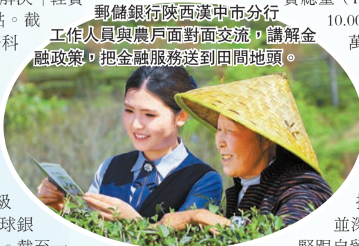
郵儲銀行陝西漢中市分行工作人員與農戶面對面交流，講解金融政策，把金融服務送到田間地頭。