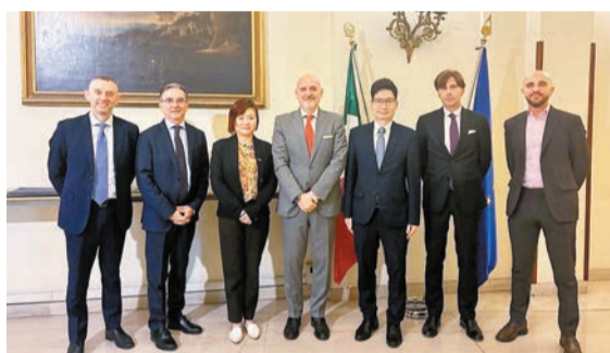
財庫局副局長陳浩濂（右三）與意大利銀行業協會領導層會面。

金融服務，協助家族辦公室進行其多元資產配置。陳浩濂介紹，香港已成為全球第二、亞洲最大的跨境財富管理中心；在全球城市中，香港擁有超高資產淨值人士數量排名第二、亞洲第一。香港家族辦公室業務持續增長，截至2025年底已有超過3380間單一家族辦公室在港營辦，兩年間增幅超過25%，估計單是營運開支已為本港經濟帶來每年約126億元的收益，並直接聘用逾10000名全職專業人員。