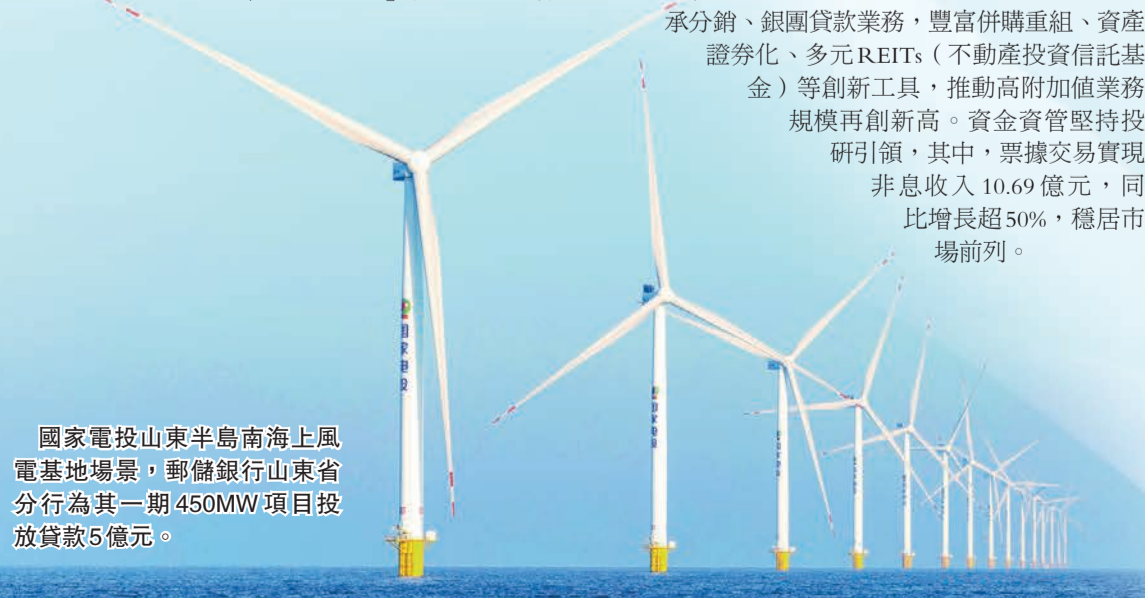
國家電投山東半島南海上風電基地場景，郵儲銀行山東省分行為其一期450MW項目投放貸款5億元。

今年3月20日，郵儲銀行全資子公司中郵金融資產投資有限公司正式開業運營。行長蘆葦在年度業績發布會上稱，會將其打造成為投貸聯動創新平台、科技創新長期資本平台、結構性改革債轉股平台和股權投資管理平台，構建起「股、貸、債、投」一體化的綜合金融服務生態。觀察郵儲銀行的整體發展生態，「綜合服務商」雛形已然顯現。具體來看，零售金融方面，個人客戶AUM規模超19萬億元，較上年末增長4.33%；富嘉及以上客戶規模達725.42萬戶，較上年末增長7.31%。公司金融方面，聚焦新動能領域，主辦行客戶和戰略客戶，提升體系化服務水平，公司客戶融資總量（FPA）達到7.47萬億元，較上年末增長10.00%。公司客戶達205.09萬戶，新增9.67萬戶；主辦行客戶11.52萬戶。