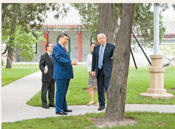
特朗普昨早抵達中南海時，習近平熱情迎接。