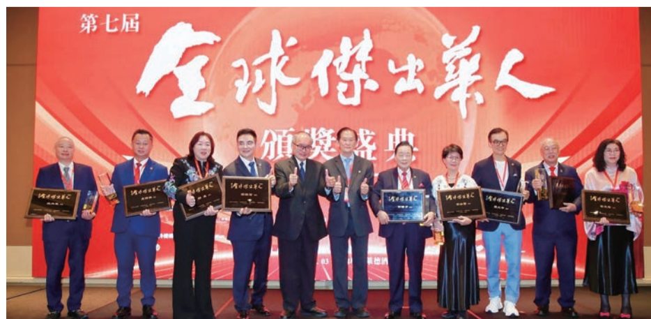
第七屆全球傑出華人獲獎人合影。