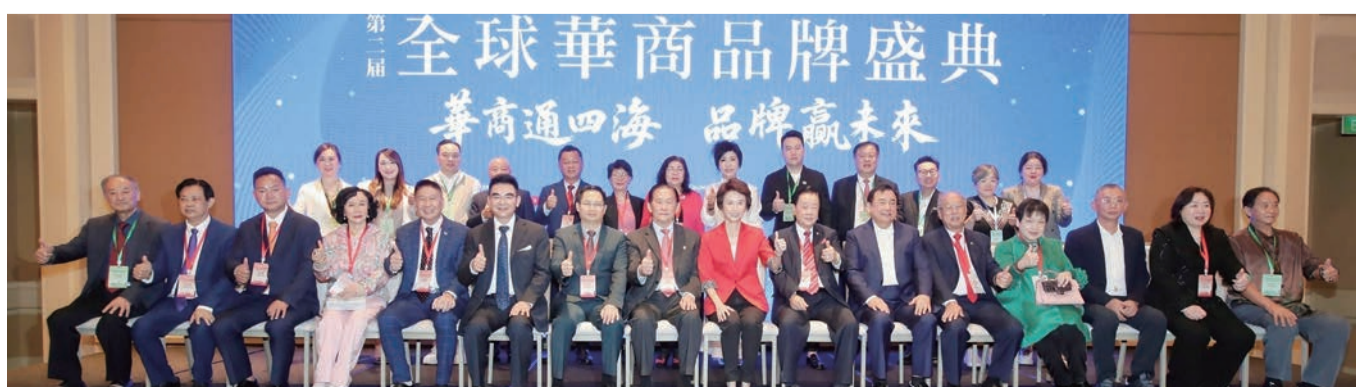
主禮嘉賓、新加坡貿工部高級政務部長劉燕玲（中）與大會主席團及獲獎人合影。