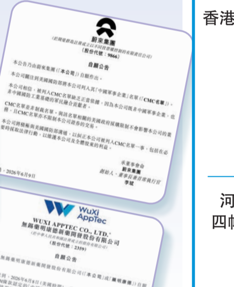
美國國防部更新「中國軍事企業清單」（CMC，即 1260H 條款清單），不僅有阿里、百度等互聯網+AI 巨頭，亦包括藥明康德、蔚來等知名公司。