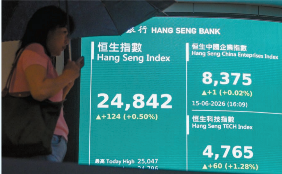
恒指昨日收報24842點，升124點。

度飆升3662點創歷史新高，距離7萬點只差318點；收報69317點升3297點或4.99%。