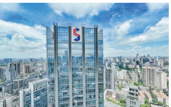
麗新發展表示，新票據按年利率8厘計息。

【香港商報訊】記者蘇尚報道：麗新發展(488)昨日公布，旗下Lai Sun MTN Limited發行並由其提供擔保、於2026年到期、息率5%的擔保票據正式啟動交換要約及同意徵求安排，相關計劃於6月15日展開，並於7月7日倫敦時間下午4時屆滿。該票據目前未償還本金總額為4.93億美元(約38.45億港元)。