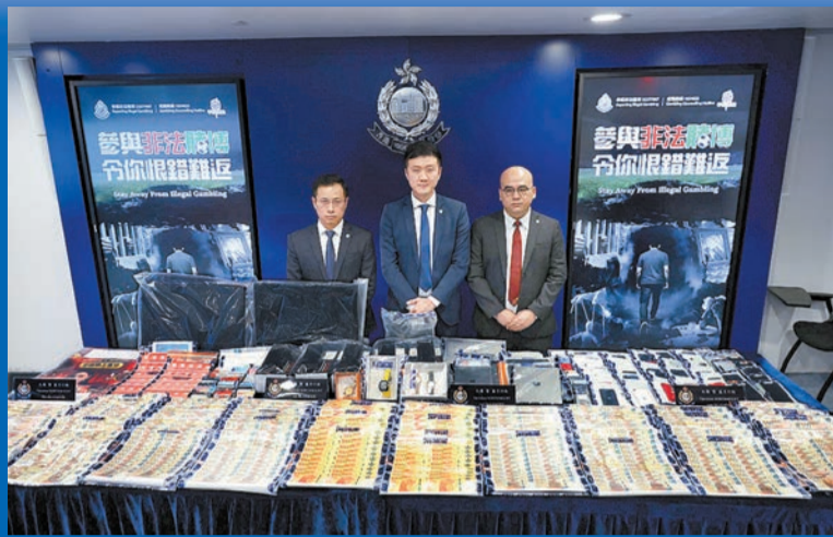
▲警方有組織罪案及三合會調查科昨日召開記者會公布案情，及講述行動經過。

【香港商報訊】記者區天海報道：警方有組織罪案及三合會調查科（俗稱「O記」）聯同全港各區刑事單位，動員逾600名警務人員，於上周五起一連三日（12日至14日）展開代號「北嶺暨藍月」的大規模反網上外圍賭博行動。行動中瓦解一個由黑社會操控的跨境非法賭博集團，拘捕150名男女，查獲超過3.2億元的非法賭資轉帳紀錄，並切斷其背後的黑社會收入來源。