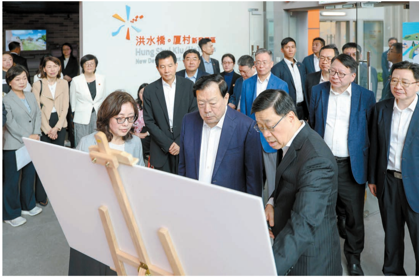
夏寶龍考察洪水橋/厦村新發展區社區聯絡中心。

當日早上，夏寶龍乘車經深圳灣口岸抵港，這次是他上任後第五次來港考察調研。夏寶龍在李家超等人陪同下，首先來到洪水橋/厦村新發展區展覽廳，內有體驗區與模型，介紹區內智慧綠色交通網絡及歷史文化資源。之後，到達洪水橋/厦村大學城選址，特區政府預留了3幅土地，至今收到19份本地大學在大學城發展的意向書，目前正在審批。接着，夏寶龍一行到訪元朗啟學路「簡約公屋」，又考察上水古洞北新發展區，並到河套港深創科園香港園區、元朗創新園微電子中心、沙嶺國際數據中心等處參觀，與一些已進駐園區企業進行交流。當天傍晚，夏寶龍到訪亞洲國際博覽館，了解香港如何把盛事轉化為經濟新動能，以助力香港把握「十五五」發展機遇。