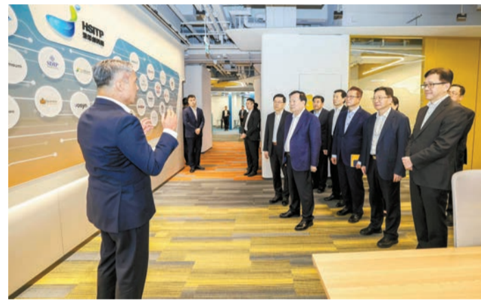
夏寶龍考察河套香港園區。